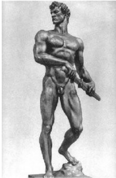
Imagen 45 Arno Breker, Bereitschaft (Disposición)