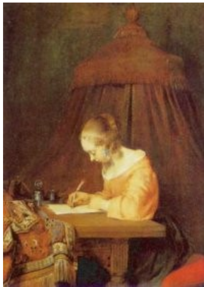
Imagen 7 Gerard Ter Borch, Dama escribiendo una carta (1655)