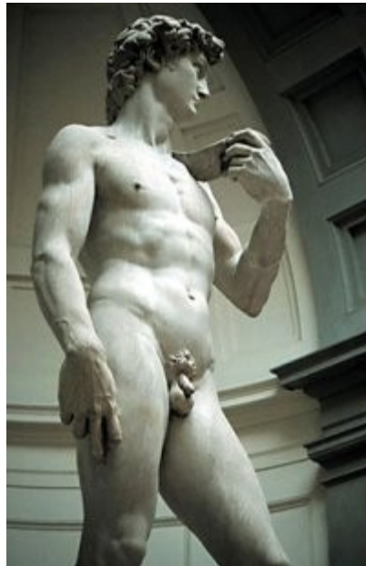
Imagen 44 El David de Miguel Angel