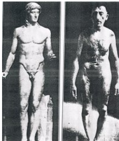
Imagen 19 Diferencias raciales