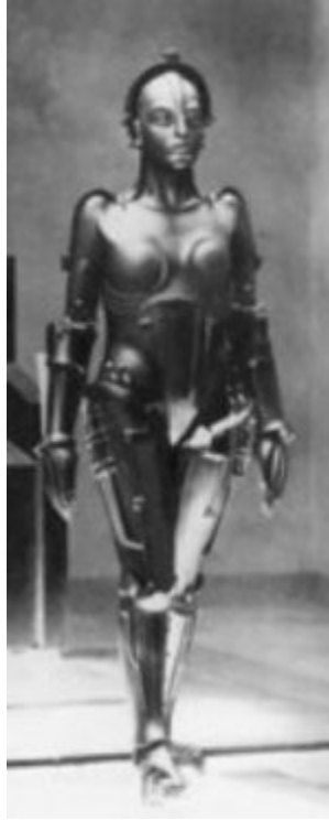
Imagen1 Fritz Lang, Metropolis : El autómata (la máquina con “alma” humana).