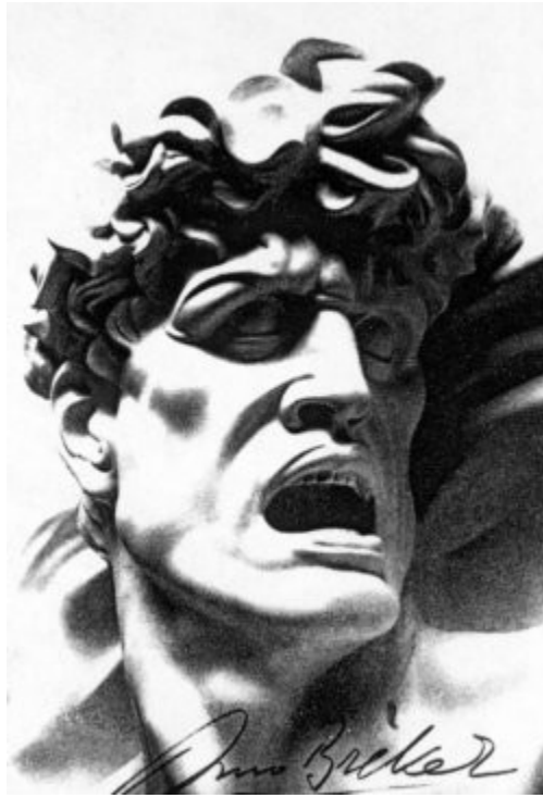
Imagen 53 Arno Breker, Camaradería (detalle)