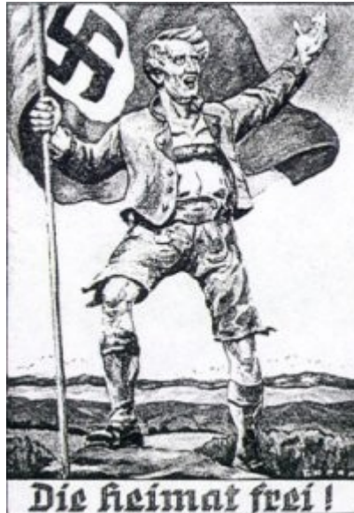
Imagen 26 Die Heimat frei (la "matria" libre), tarjeta postal