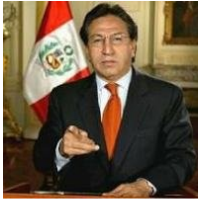
Imagen 14 Alejandro Toledo