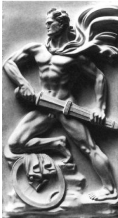
Imagen 31 Arno Breker, Guardián de la frontera