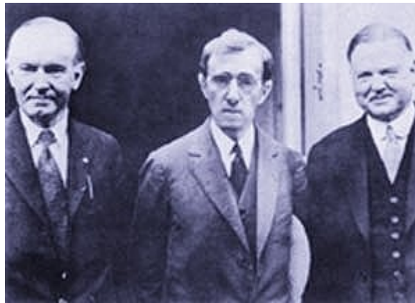
Imagen 15 Woody Allen, Zelig (entre white celebrities)