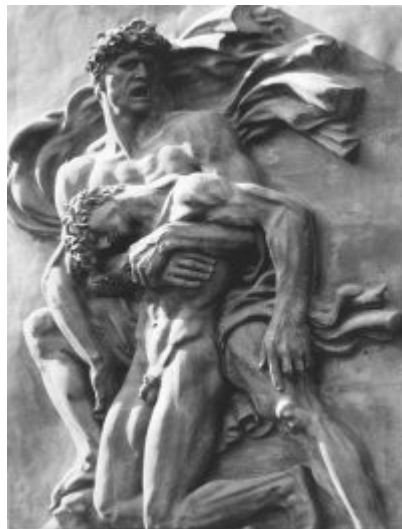
Imagen 40 Arno Breker, Camaradería