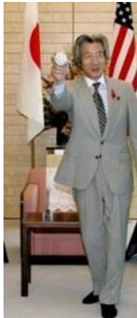
Imagen 13 Junichiro Koizumi