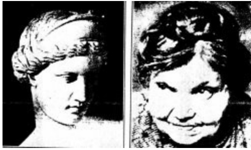
Imagen 20 Diferencias raciales