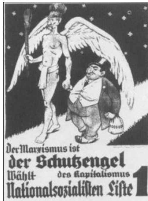
Imagen 23 “El marxismo, ángel protector del capitalismo”