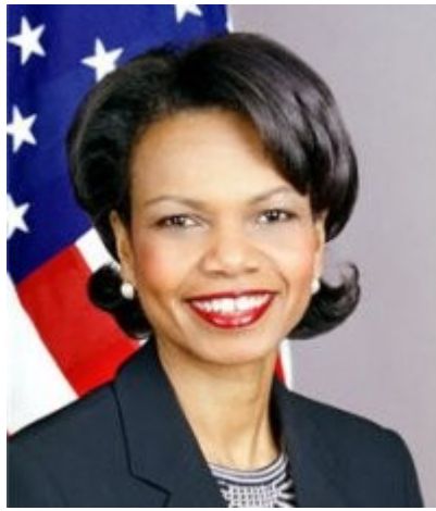
Imagen 12 Condoleeza Rice