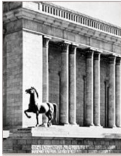
Imagen 35 Albert Speer, Fachada de la Neue Reichskanzlei