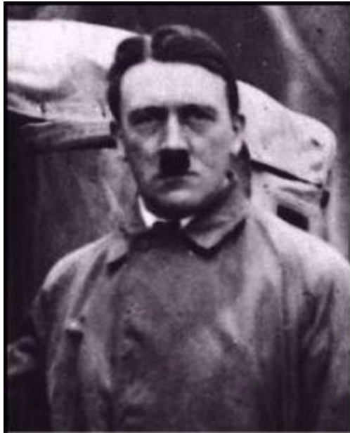
Imagen 43 Hitler, 1924, Detalle