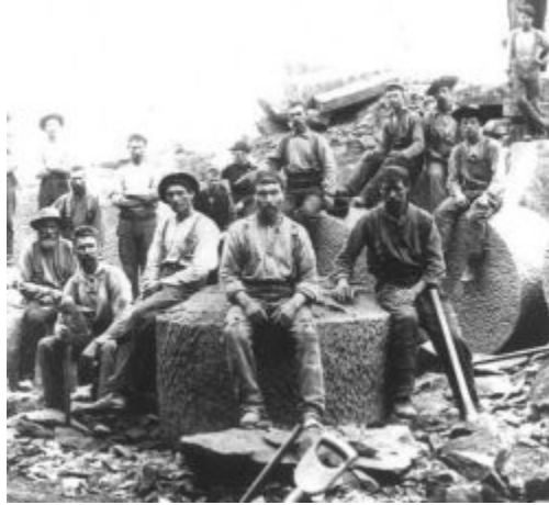
Imagen 10 Obreros de raza blanca