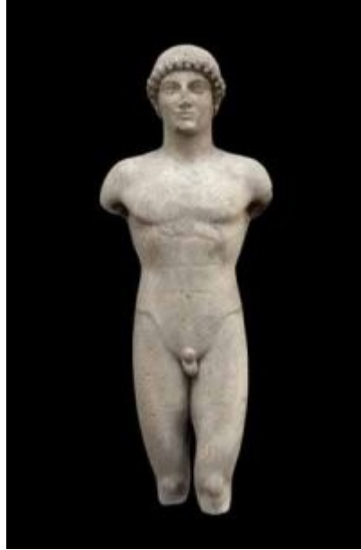
Imagen 30 Un Kouros