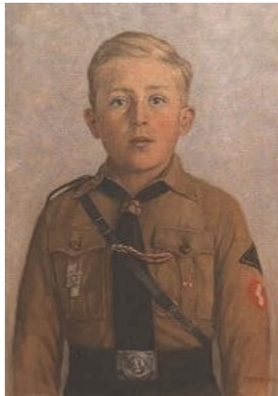
Imagen 38 T. Rieger, Niño de la Hitlerjugend