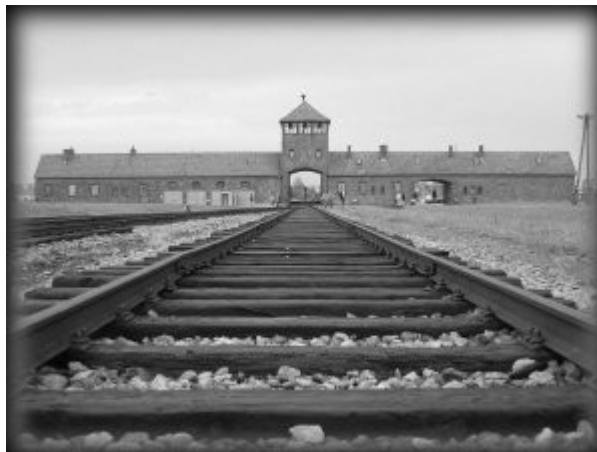
Imagen 56 Auschwitz, entrada