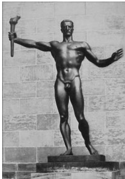
Imagen 32 Arno Breker, El partido o El portador de la antorcha