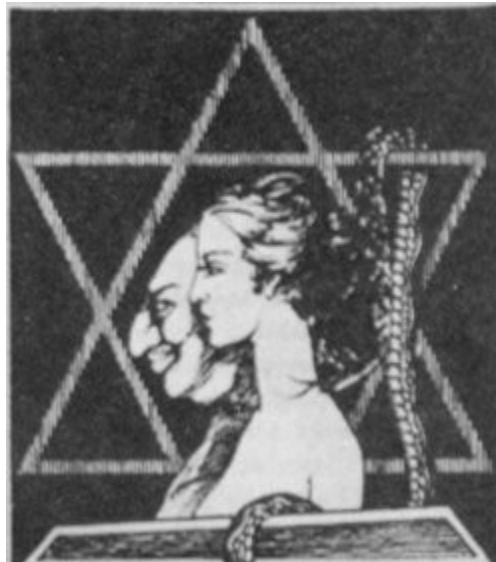
Imagen 27 "Parasitismo judío", (hoja volante)