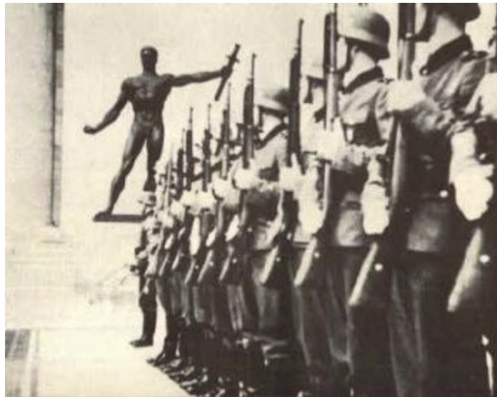
Imagen 54 Arno Breker, Guardia en el patio de la neue Reichskanzlei