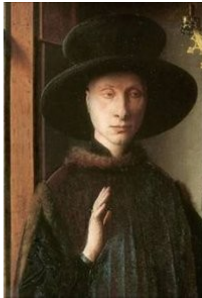
Imagen 3 Jan van Eyck, Matrimonio Arnolfini (1434), detalle.