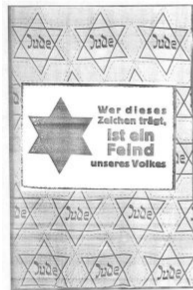
Imagen 28 La marca del enemigo