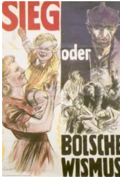
Imagen 22 Victoria o bolchevismo (afiche)