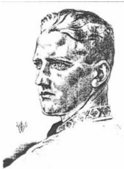
Imagen 16 Hombre ario (tarjeta postal)