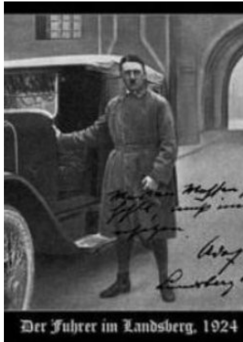
Imagen 42 Hitler 1924