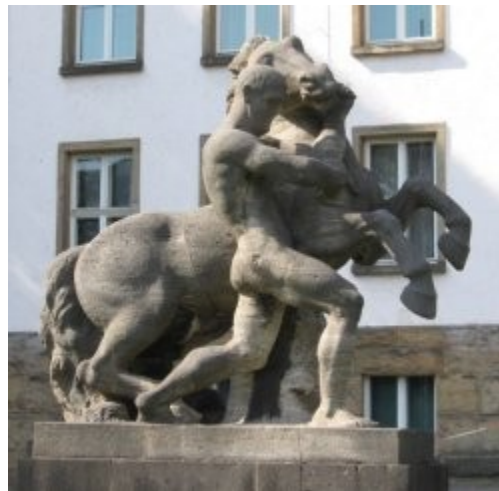
Imagen 46 Joseph Wackerle, Domador de caballos