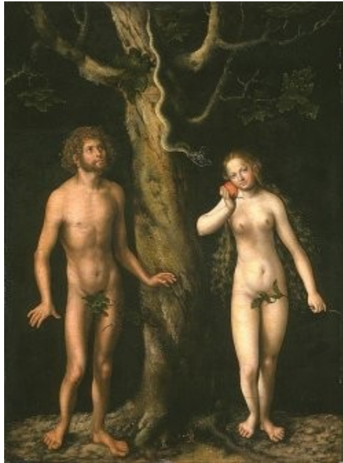
Imagen 8 Lucas Chanach, Adán y Eva (1528)