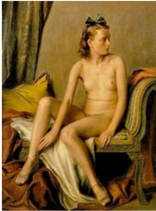
Imagen 52 Adolf Ziegler, Desnudo femenino