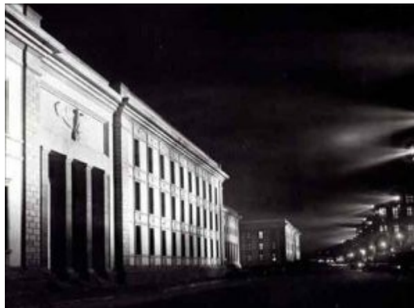
Imagen 36 Albert Speer, Neue Reichskanzlei (vista nocturna)