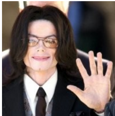
Imagen 11 Michael Jackson