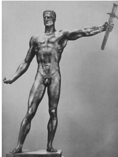
Imagen 33 Arno Breker, El ejército o El portador de la espada