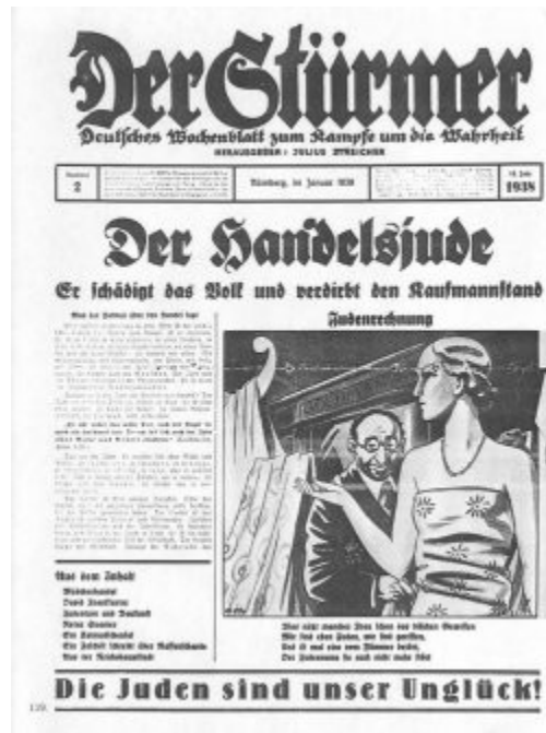
Imagen 24 El judío comerciante, Titular de Der Stürmer Estribillo: “Los judíos son nuestra desgracia” (1)