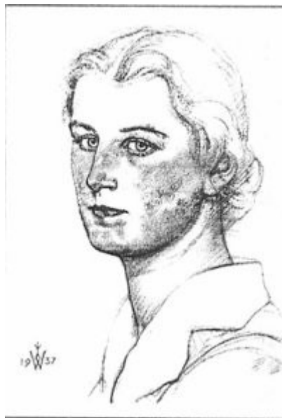
Imagen 17 Mujer aria (tarjeta postal)