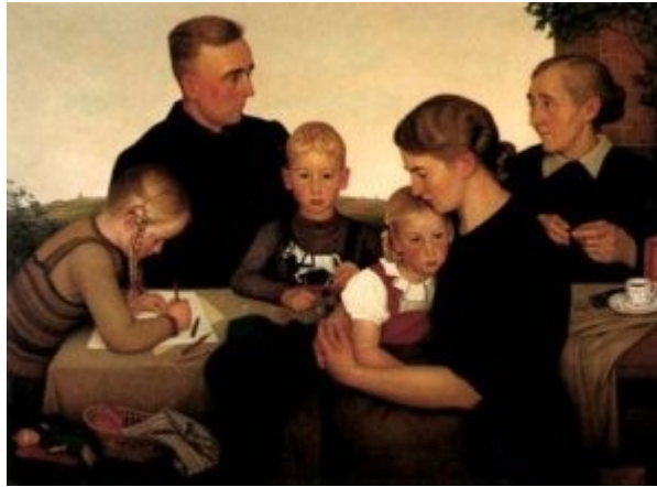
Imagen 37 A. Wissel, Familia campesina de Kalenberg