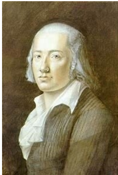
Imagen 9 Friedrich Hölderlin, un “blanco” no apto para la blanquitud