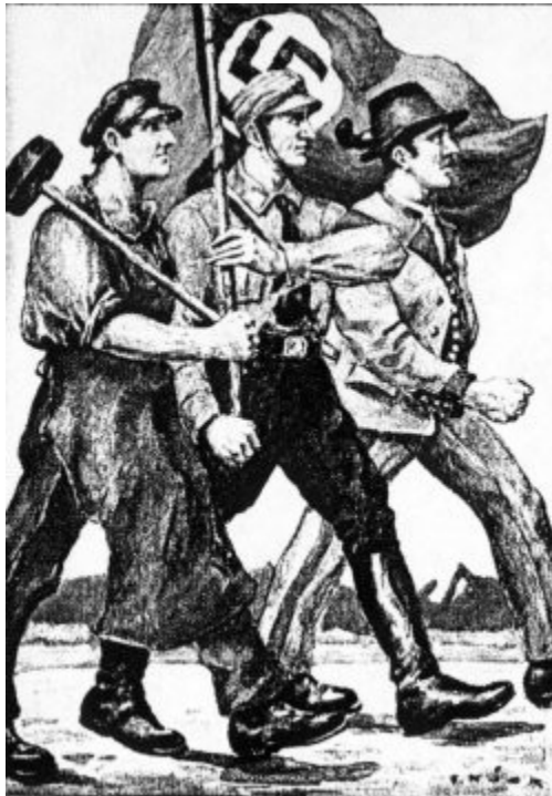
Imagen 21 Obrero y campesino alemanes guiados por un SA-Mann