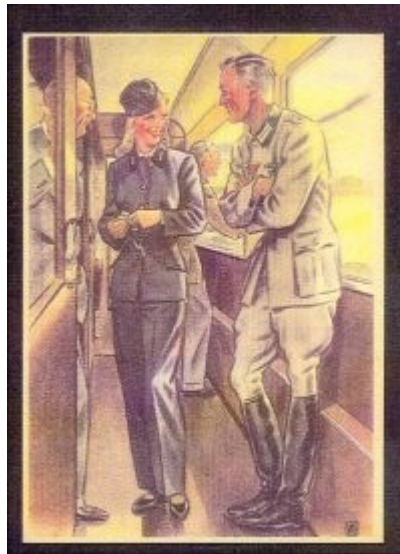
Imagen 18 Flirt entre arios (tarjeta postal)