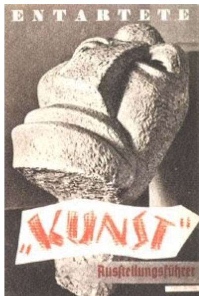
Imagen 48 Arte degenerado (guía de la exposición)