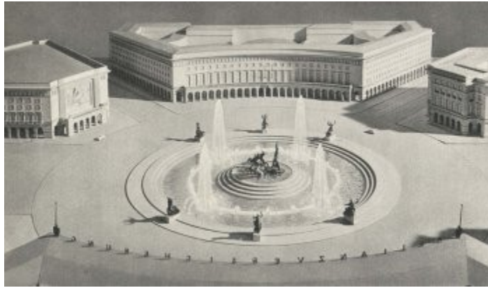
Imagen 41 Arno Breker, Rotonda con Fuente de Apolo