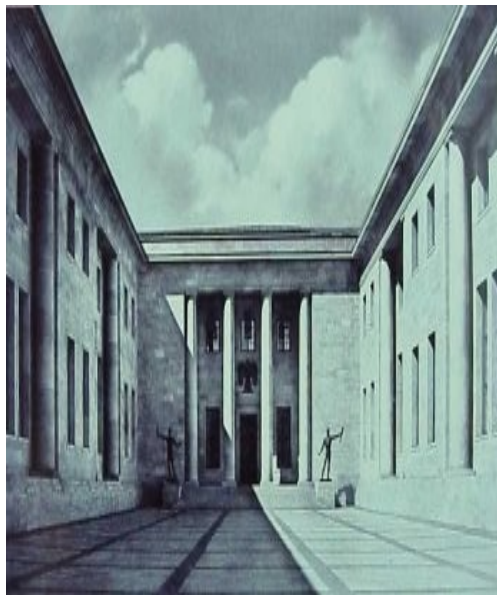
Imagen 34 Albert Speer, Patio de honores de la Neue Reichskanzlei