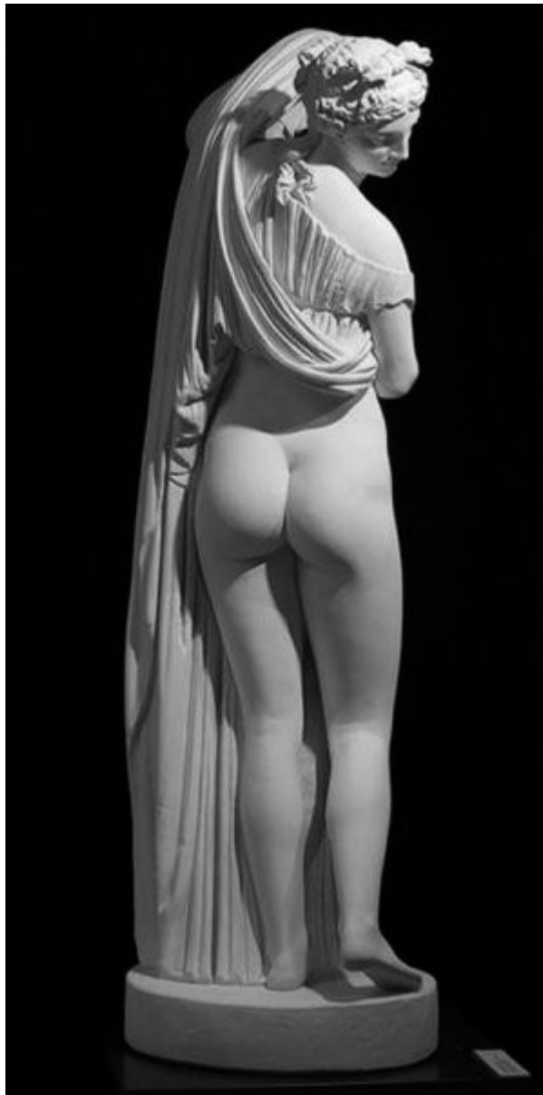
Imagen 49 Afródita Kallipygos