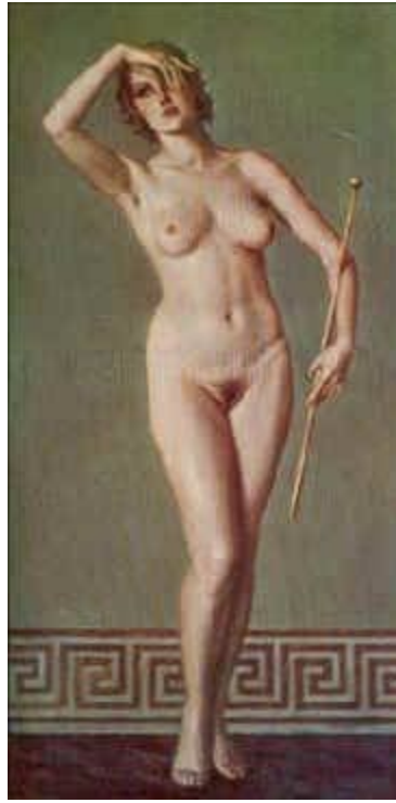
Imagen 2 Adolf Ziegler, La musa de la danza : (lo humano con “alma” maquinal).